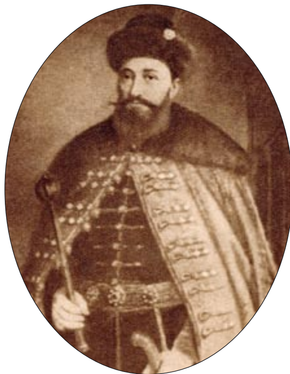
A „nagy fejedelem”

Mégis volt egy hely, ahol Bethlen Gábor fejedelemsége kiverte a biztosítékot. A bécsi udvar nem tudott napirendre térni a fölött, hogy a Báthory Gábor uralkodásának utolsó éveiben bekövetkezett közeledés Bécs és Erdély között Bethlen színre lépésével abbamaradt. Melchior Khlesl bíboros, II. Mátyás mindenható minisztere háborút akart indítani Bethlen eltávolítása érdekében, ám ezt a magyar-osztrák-cseh-morva rendek együttes linzi gyűlése elutasította. Így az udvar 1615-ben Nagyszombatban kénytelen-kelletlen titkos megállapodást kötött Bethlennel. Ebben elismerték a hatalmát, viszonzásként a fejedelem elismerte, hogy Erdélyt a Habsburgok beleegyezésével birtokolja, és megfogadta, hogy törökön kívül minden más el-