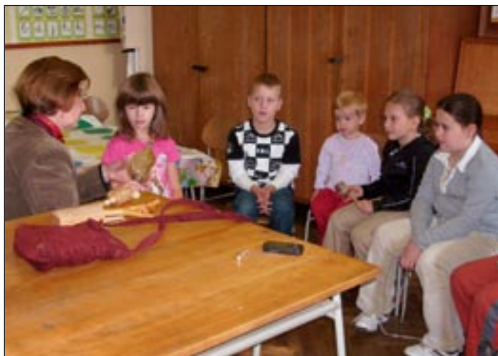
A vasárnapi iskolában népi hangszerek bemutatójára is sor kerül