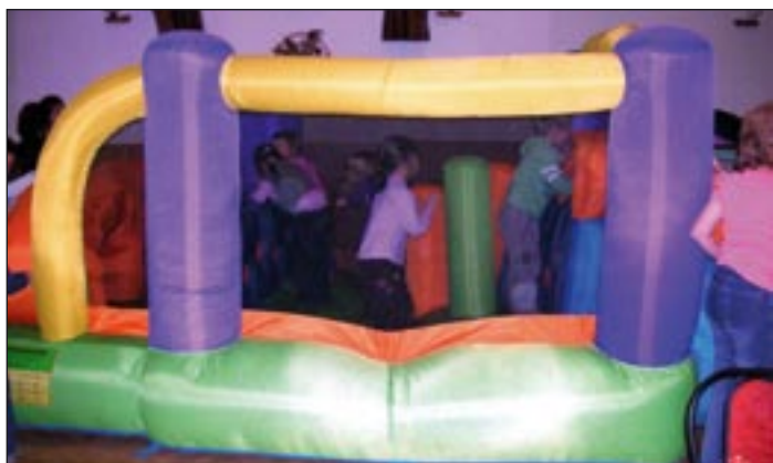
Az ugrálóvárat szívesen megostromolják a gyerekek

Mi mást is kívánhatnék szülőknek, iskoláknak és az egész felvidéki magyarságnak, mint hogy jó döntések születessenek januárban-februárban!