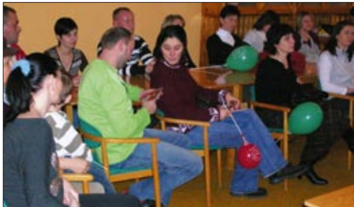
Hasznos, ha a szülők másoktól is hallják az anyanyelvi oktatás melletti érveket