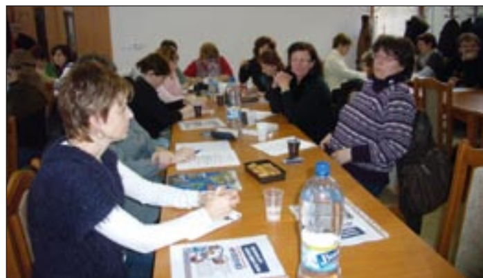
A bővített választmányi ülés résztvevői