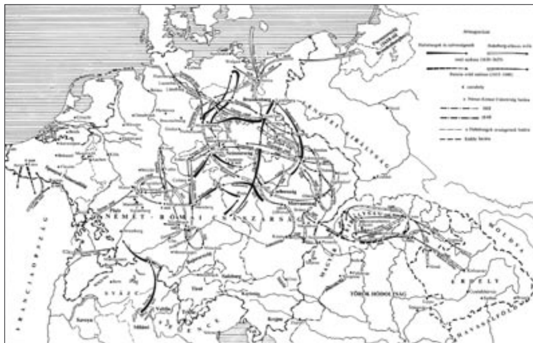
A 30 éves háború hadműveletei