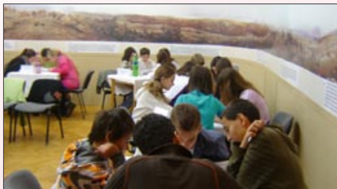
A Feszty-körkép másolatáról, amely körbe fut a falakon, néha puskázni is lehet