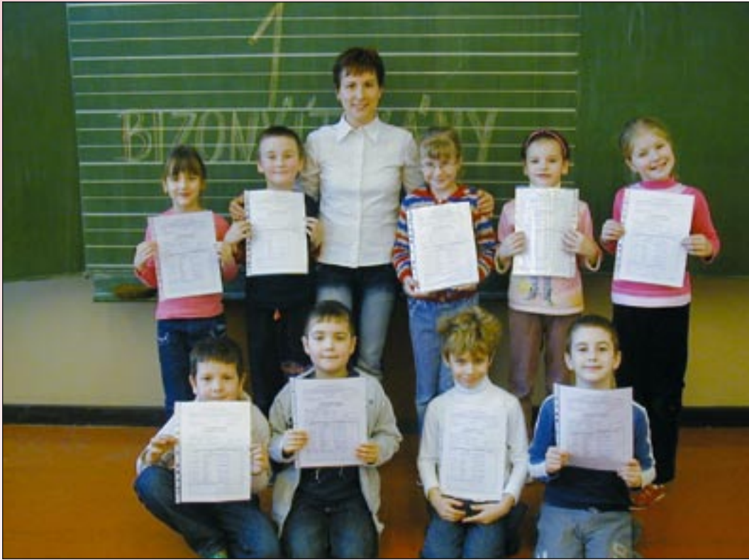
A féli kisiskolások a félévi bizonyítványaikkal

Ismét eltelt egy esztendő, s ilyenkor hagyományosan (január végén, február elején) az érintett szülők gyermekeiket az első osztályba íratják.