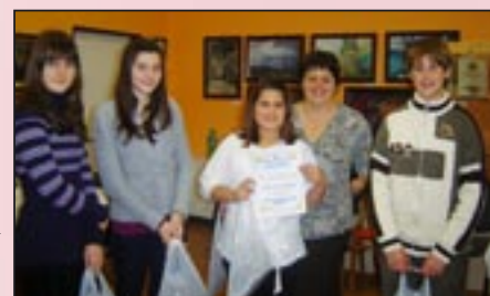
→ A dél-komáromi iskola csapata