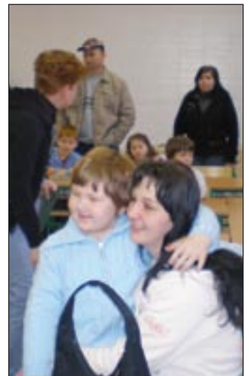
Látod, milyen jó lesz itt neked