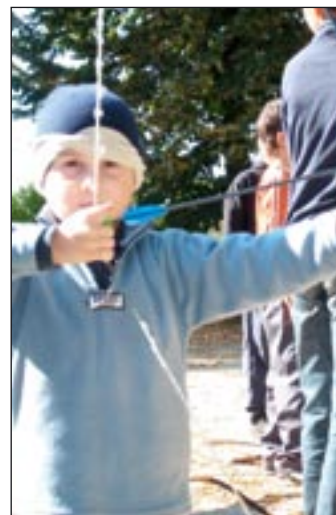
Vasárnapi Iskola – íjászkodás

nék iskolánkat, tanítási-tanulási módszereinket, egyszóval betekintést nyernének az iskolánk életébe. E célból nyitott napot tartunk: a 2009/2010-es tanévben január 27-én. Egy rövid kis műsorral készülünk, majd a szülők részére három rövidített tanítási órát mutatunk be az 1-2. osztályban. Megláthatják, milyen előnyökkel jár egy összevont osztályban való