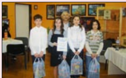
← A győztes ógyallai csapat