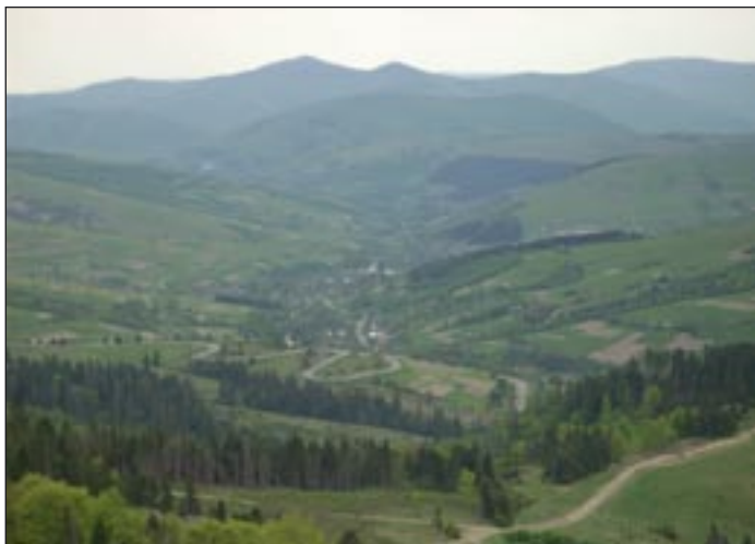
Nem csoda, hogy annak idején Árpádot és társait megbabonázta a táj.

A hágót ma már elkerüli a fő útvonal, 1980-ban a moszkvai olimpia idejére új vonalvezetésű utat készítettek Munkács és Lvov között. Csak mi, magyarok járunk