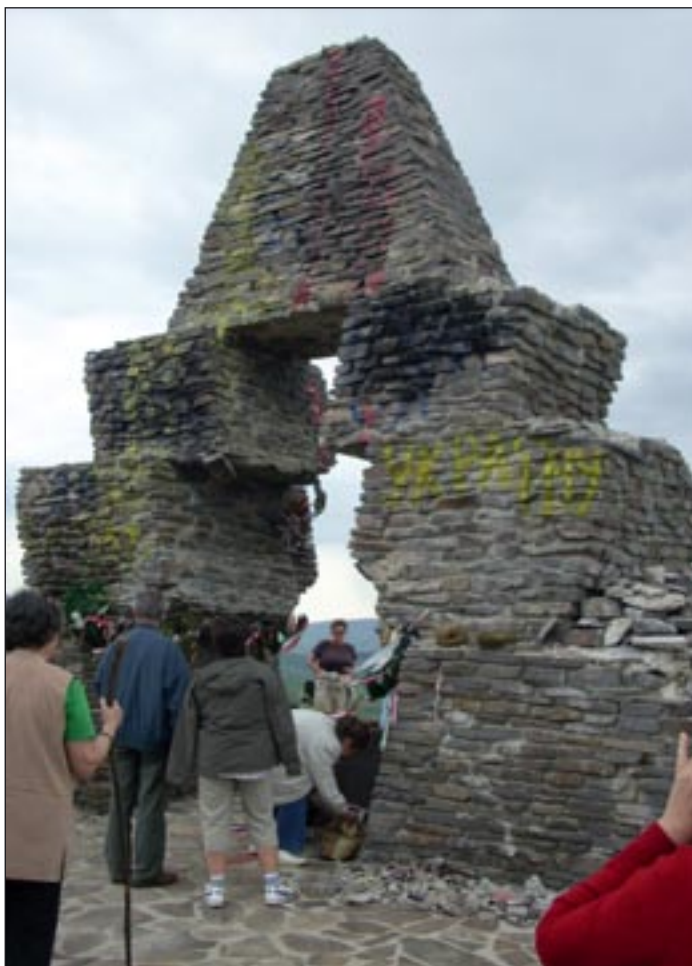
A nacionalisták által festékkel leöntött emlékmű

erre... Az elhagyatott út mellett ugyanúgy elhagyatott építmények láthatók: a hágón a néhány évtizede befejezetlen motel málladozó falú épülete áll. Egy hegyi pásztor szobra, egy kereszt s egy buszbeálló összességében elég siralmas látványt nyújt