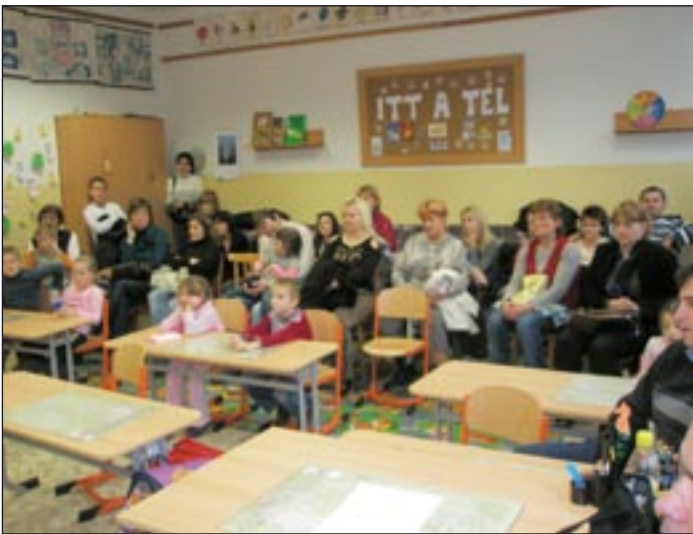
A szülők is benépesítik az osztályt

Iskolánkban már több éve oly módon szervezzük az iskolába való beiratkozási programot, hogy a gyermekeket játék közben tudjuk megfigyelni különféle, erre a célra szolgáló eszközök segítségével. Az eszközök és a módszerek nagy részét azokból a forrásokból merítjük, amelyekhez az elmúlt években tartott továbbképzéseinken jutottunk hozzá.