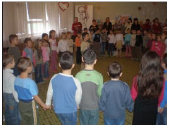
Lánc, lánc, eszterlánc...