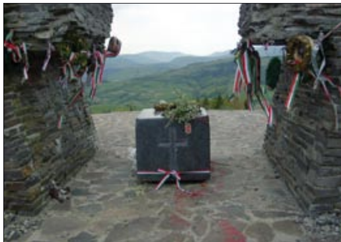
Nemzetiszínű szalagokkal díszített emlékmű egy részlete

Több lépcső vezet fel az emlékműhöz, amelynek terü- letét a Magyarok Világszö- vetsége Csoóri Sándor elnök-