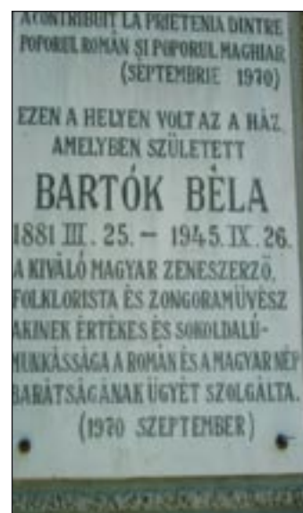
Emléktábla az egykori szülőház helyén álló épületen