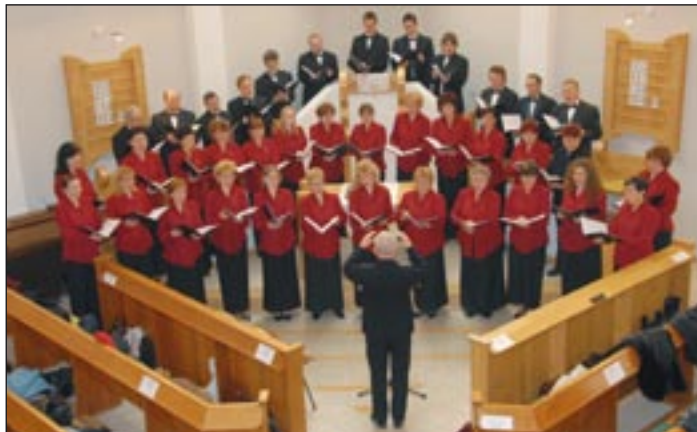
Vezényel Sapszon Ferenc, Liszt-, valamint Bartók–Pásztory-díjas kiváló karnagy

Ezt követően Prágában rangos nemzetközi versenyen – egyetlen szlovákiai versenyző kórusként – aranyserleget szereztünk a zsűri különdíjával a legjobb műsor-összeállításért. Guerrero reneszánsz darabját spanyolul, Britten Mária-himnuszát kettős kórusra az anglikán egyház nyelvében és latinul, Mendelssohn nyolcszólamú romantikus művét németül, majd Kodály műveit latinul és Kocsár szerzeményeit magyarul énekeltük, nagyszerű karnagyaink művészi megfogalmazásában. A prágai sikerszereplés után, december 12-én Pozsonyban, a Szlovák Rádió koncerttermében emlékeztünk Kulcsár Tibor költőre, aki a pedagóguskórus egyik alapítója és első elnöke volt.