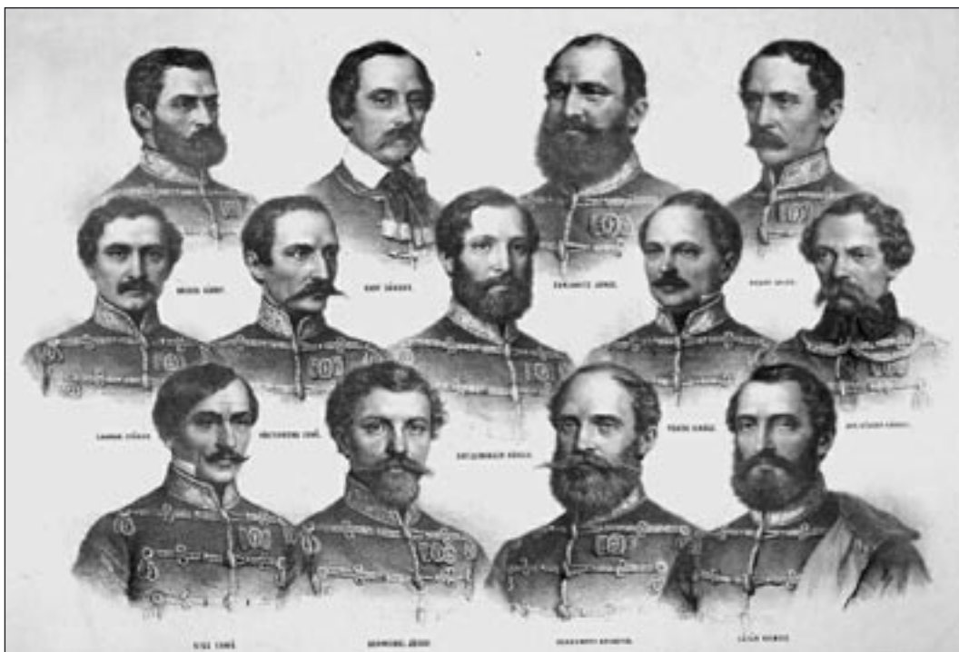
Az aradi tizenhárom

A megtorlás ezzel nem ért véget: a hadbíróságok mintegy ötszáz halálos ítéletet hoztak, ebből kb. százhuszat hajtottak végre. Több mint ezerötyszáz embert zártak Theresienstadt, Kufstein, Olmütz, Josephstadt iszonyú börtöneibe. 30-40 ezer honvédet besoroztak a császári hadseregbe, őket cseh, osztrák, olasz területekre vittek szolgálni. „Most tél van és csend és hó és halál / A föld megöszült...” – foglalta versbe az ország és a nemzet állapotát Vörösmarty.