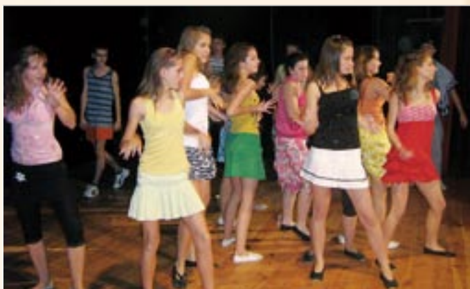
Az Érsekújvári Rockszenpad műsora