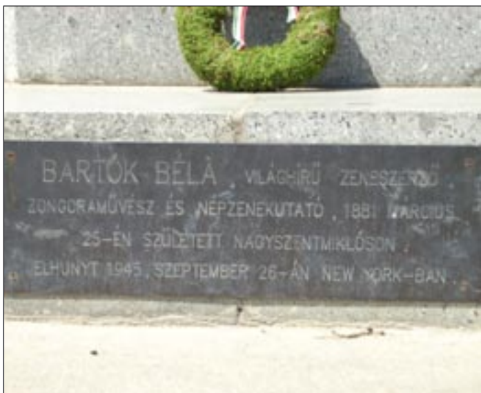
A Bartók-szobor talapzatán levő szöveg