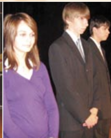
A Czuczor Gergely Alapiskola díjazottjai