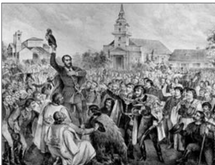
Március 17-én gróf Batthyány Lajos felelős magyar kormányt alakított

A magyarországi büntető intézkedések élénk visszhangot váltottak ki külföldön. A magyarok elleni bosszúhadjárat leállítását követelte töb-