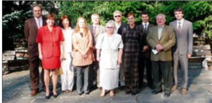
Az iskola tanári kara