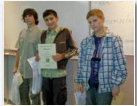
Az I. kategória győztesei

A Nemzeti Emlékezet Program keretében a magyar kormány 1127/2003. (XII.17.) számú határozatával Kazinczy Ferenc negyedéves szünetnapja alkalmából a 2009. évet a Magyar Nyelv Événak nyilvánította. Az érsekújvári Pázmány Péter Gimnázium vezetése úgy döntött, szeretne erről méltóképpen megemlékezni. E célból regionális szövegértelmezési anyanyelvi vetélkedőt szerveztek, amelyre négy járás iskoláiból (Lévai, Nyitrai, Érsekújvári, Komáromi) érkeztek a diákok 2009. október 26-án.