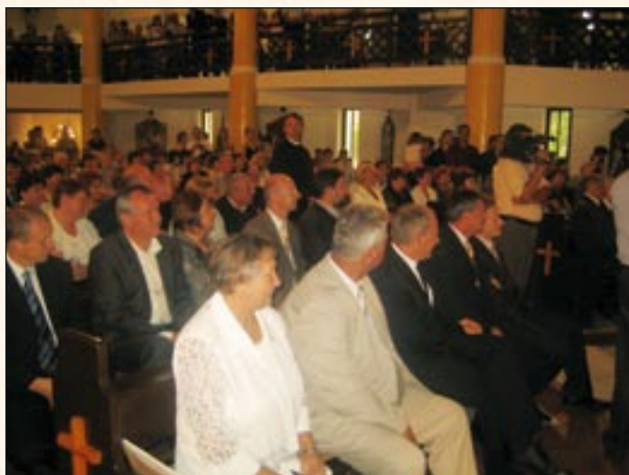
Az országos tanévnyitót mindig nagy érdeklődés kíséri

Egyetlen dolgot kell erősen akarnunk: hinni önmagunkban, akkor a világ is hisz bennünk. Ha szenvedéllyel, elhivatottsággal, erős akarral dolgozunk, az jókedvet ad, derűt és harmóniát szül, bizalmat és reményt ébreszt mindenkiben. Így lesz a tudásnak értéke, az embernek tisztelete.