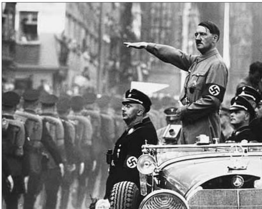
Hitler üdvözlí a Lengyelországba induló csapatokat, 1939. szeptember 1.