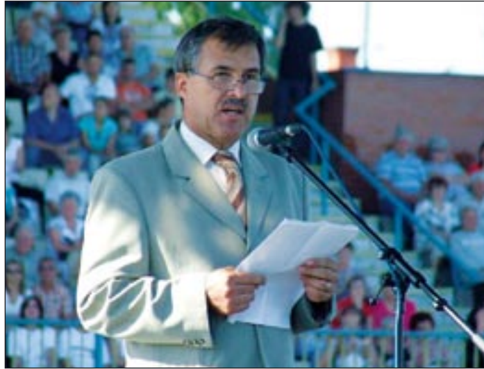
Az anyanyelv nem piros-fehér-zöld, és nem piros-fehér-kék színű.

Nemcsak sajnálatos, de a 21. század együttéléséhez nem illő, a sokszínűsége épülő Európai Unió elveit sértő, hogy a hatalmon levő szlovák politikai elit emberek közötti feszültséget szító nyelvtörvény-módosítást erőltet ránk