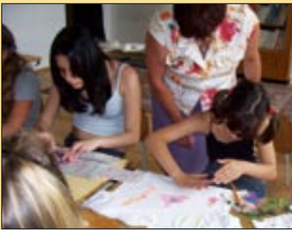
Dolgozni csak pontosan, szépen ...