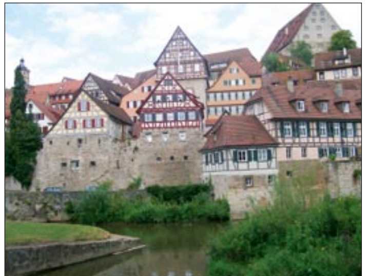
Schwäbisch Hall-i utcakép

Ramadán alatt mit és mikor lehet a hitű muzulmán. Kínai kollégáink megtanítottak bennünket a kínai pálcika használatára, török kollégáink pedig a legjobb kebab éttermekbe invitáltak bennünket. Rendkívüli nyitottsággal és kíváncsisággal közeledtünk egymás felé, a programok és a jó hangulatú közös projektek mind hozzájárultak ahhoz, hogy igazi csapattá kovácsolódtunk össze. Számos életre szóló barátság szövődött, melyek a jövőbeli közös iskola-projektek alapját is képezik majd.