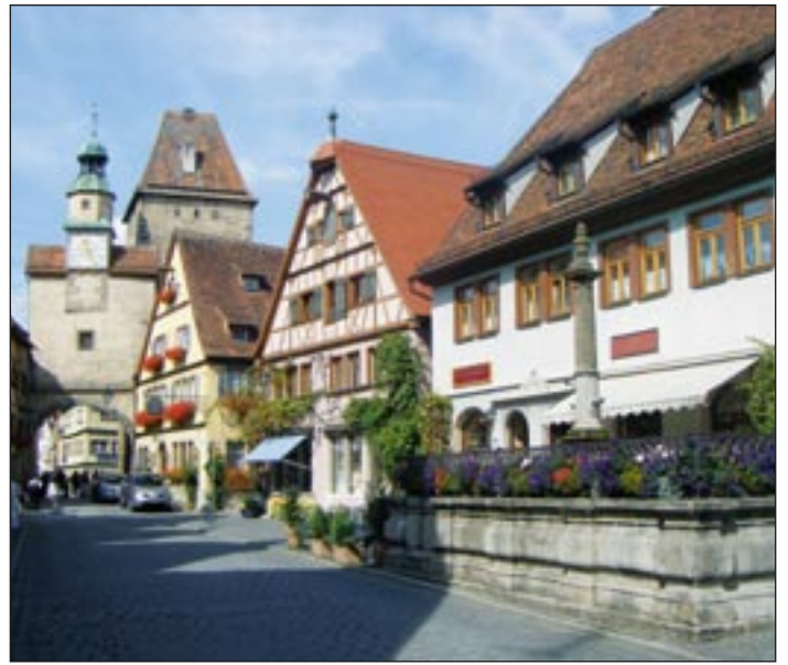
Schwäbisch Hall-i utcakép

A kéthetes továbbképzés alatt mind nyelvileg mind szakmailag nagyon sokat fejlődöttünk, a Goethe Intézet valóban mindent megtett annak érdekében, hogy jól érezzük magunkat Németországban, így erősítve bennünk a német nyelv és kultúra iránti érdeklődést. Az együtt töltött idő alatt azonban emberileg is nagyon sokat fejlődöttünk, világlátásunk szélesedett. Ebben a multikulturális környezetben alkalmunk nyílt megismerni egymás kultúráját: muzulmán kollégáinknak órákig magyaráztunk az evangélikus templomban a katolikus és az evangélikus vallás közötti különbségeket, mi viszont teljes gasztronómiai tanácsadást kaptunk arról, hogy a