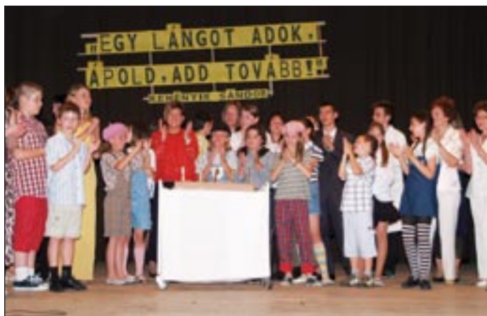
A Móra név felvevésének 5. évfordulója

A készülődés, a várakozás nemcsak egyházi és állami ünnepeinket teszi izgalmassá, hanem azokat a napokat is, amelyeket mi emberek ünneppé avattunk. Egy intézmény névadó ünnepe, alapító okirata emlékeztet arra, hogy valami született, ami a miénk: ápoljuk, emlékezzünk rá, tegyünk érte valami maradandót. A nemesócsai Móra Ferenc Alapiskola 5. születésnapját ünnepeltük a legszebb hónap 21. és 22. napján.