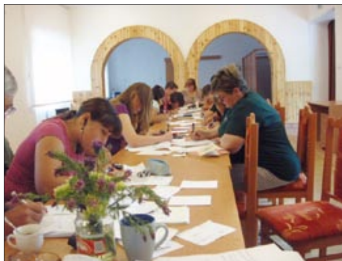
A gyűjtött adatokat minél előbb kicéculázzuk