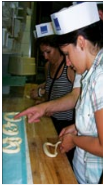
Amikor tanárok sütik a peracet