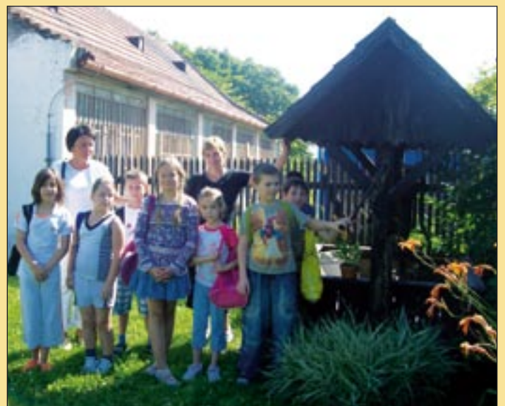
Csoportunk a taksonyi tájházban