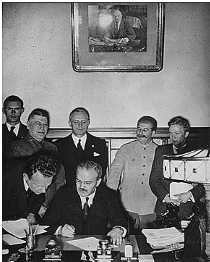
A Molotov-Ribbentrop-paktum aláírása, 1939. augusztus 23.

Az amerikai H. S. Commager az A második világháború története című kitűnő munkája bevezetőjében felteszi a kérdést: „Miként történhetett, hogy az a nemzedék, amely még alig gyógyult ki az első világháború fájdalmas sebéből, belefogott ebbe a második és sokkal szörnyűsebb háborúba?” Ma már teljesen egyértelmű, hogy a versailles-washingtoni békecsinálók által kreált biztonsági rendszer csődöt mondott. Ennek eklatáns példája az amerikai kezdeményezésre létrehozott Népszövetség, amelyet Genf központtal 1920-ban azért alapítottak meg, hogy az egyes államok (nemzetek) között kialakult esetleges konfliktusokat a szervezet keretében kezelni tudják. Ám az 1930-as években azok az agresz-