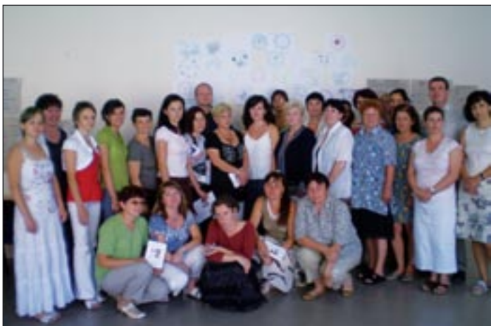
Csoportkép a nyári egyetem résztvevőiről