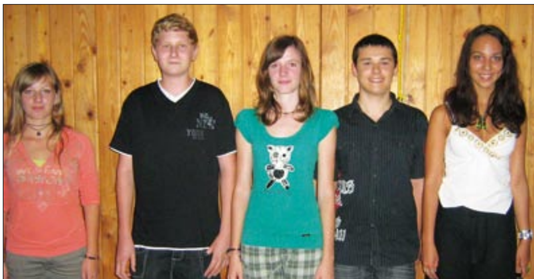
A sextások győztes csapata

Az intézményben jelenleg is megtekinthető két fotókiállítás az afganisztáni iskolákról, s vendégkönyv híján, a falon üresen maradt felületekre lehet üzenetet írni. Csak egy diák véleménye a sok közül: „Jó volt betekinteni egy más világba, sok érdekeset megtudtam. Díjazom az efféle tanítási módszereket.”