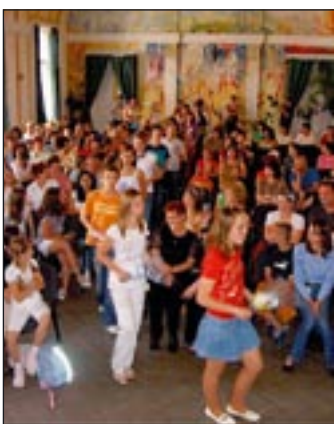
Az óriási érdeklődés igazolja, hogy szükség van erre a táborra

A tábor megnyitójára a komáromi Eötvös Utcai Alapiskolában került sor. Mácza Mihály történész „Jókai Mór Komáromja” című előadásával utat nyitott a gyerekek érdeklődésének, hogy minél többet megtudjanak Komárom nagy írófejedelméről. Az ismeretek bővítésére szolgált a balatonfüredi tanulmányút is. Itt