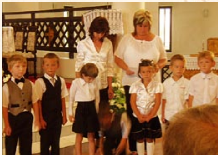
A meghatódott kis elsősöknek már kitárultak az iskola kapui

Az ember életét a születéstől a halálig olyan erkölcsi összhang és egyetemes emberi értékek tartják össze, melyek értelmet visznek a minden napokba, melyek elsőbbséget élveznek a talmi előtt, melyek alapját képezik a rendezett családi, társadalmi, szakmai közösségeknek, ugyanakkor a jellem építői és meghatározói is.