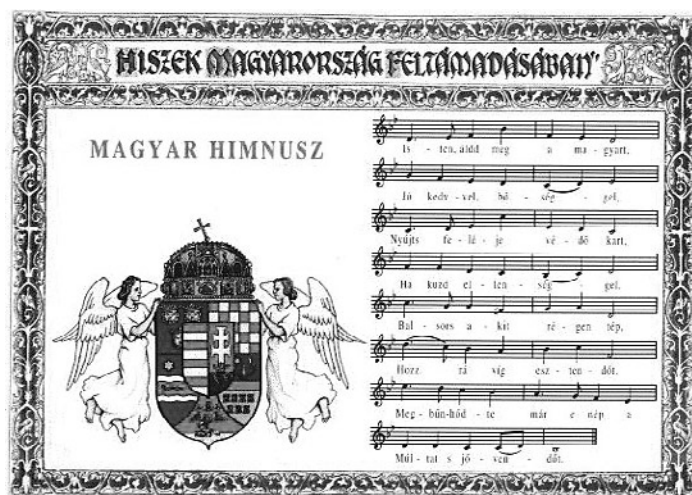
Kölcsey Ferenc: Magyar Himnusz

meiket. S a szülők ekként cselekedtek. Amikor „időtelve” a szülők s a dajka a kemence ajtaját kinyitották, a kis Ferenc jött is kifele, de a kemence előtt levő hamuból egy égő szikra felpattant, s ez égette ki szemét. E gyermekkorai sérülés végigkísérte a reformkor nagyjának egész