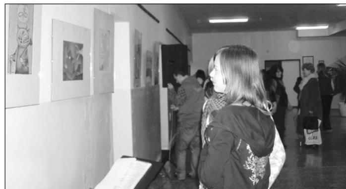
A kiállított képek megmozgatják a gyerekek fantáziáját

Napjainkban olykor úgy tűnik, hogy visszaszorulóban van az igazi értékek iránti igény. Iskolánk sem lehet közönyös e tény iránt. Megszüntetni biztosan nem tudjuk a negatív jelenséget, de megpróbáljuk visszaszorítani a médiák felénk áradó