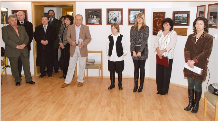
A galéria szervezői fontosnak tartják Gömörben a művészet jelenét