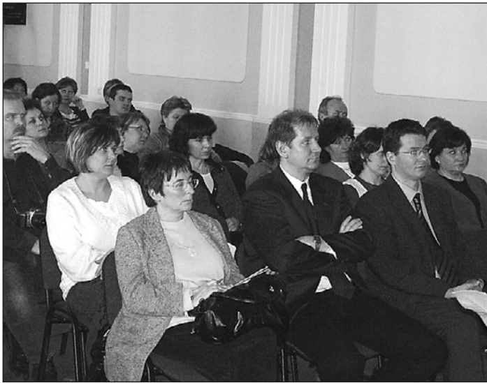
A megnyitó résztvevői