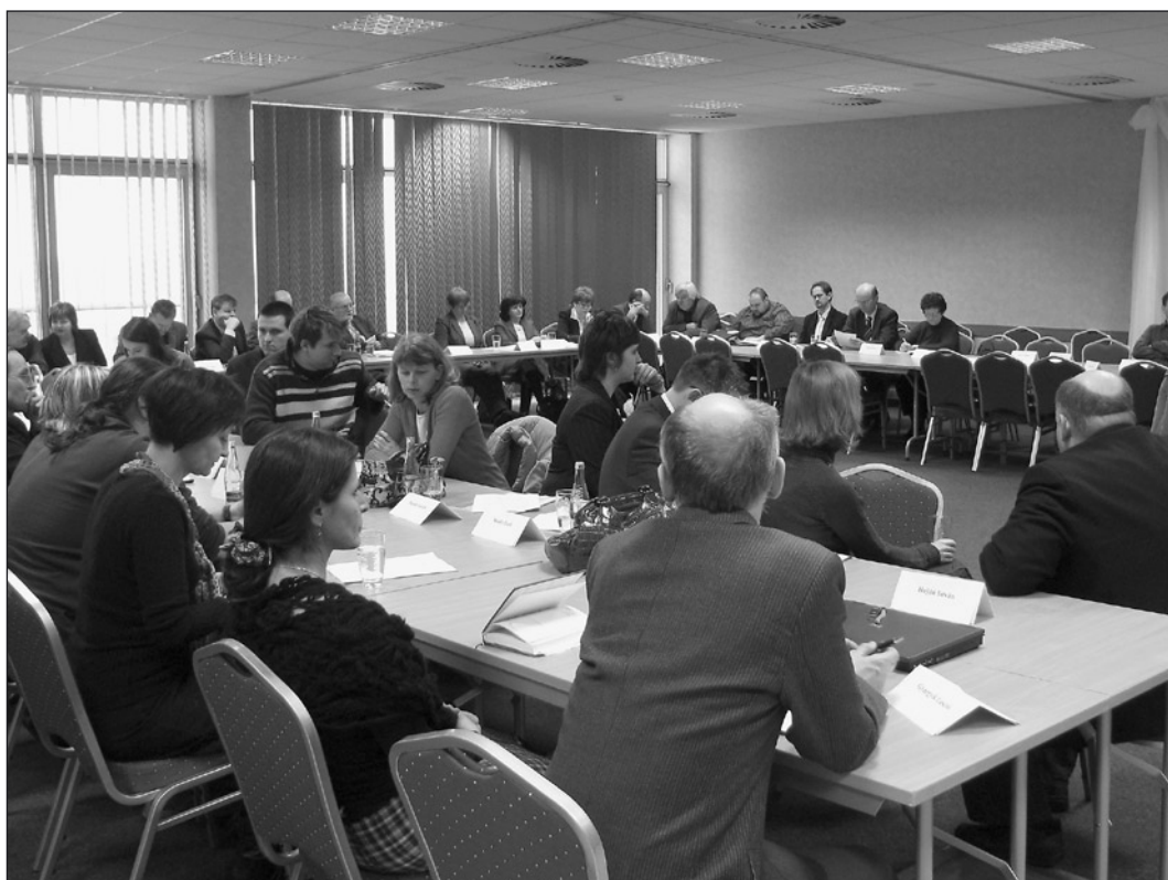
A Szlovákiai Magyarok Kerekasztala (Cikk a 17. oldalon.)

Meggyőződésünk, hogy a kisebbségek nyelvén folyó oktatás megkülönböztetett figyelmet és gondoskodást érdemelne az állami oktatási szervek részéről – mind politikai, mind szakmai szempontból egyaránt.