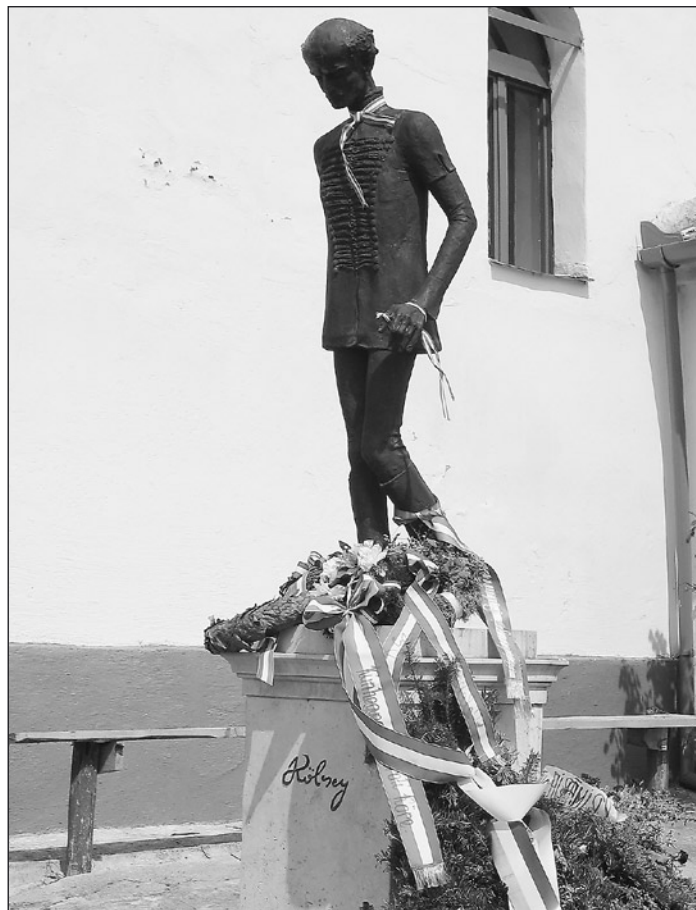
Kölcsey szobra, amely karcsúságával, véznaságával sokakat megdöbbsent: az erélyes, elveihez ragaszkodó irodalomtörténész nem így testalkatúnak képzelte el az utókor...

A szájhagyomány szerint talán négy éves lehetett a gyermek, amikor elkapta a feketehimlőt. A család dajkája azt javasolta a szülőknek, hogy próbáljanak ki egy régi, bevált népi gyógymódot, mégpedig egy enyhén fűtött kemencébe tegyék be néhány órára a fertőző betegségben szenvedő gyer-