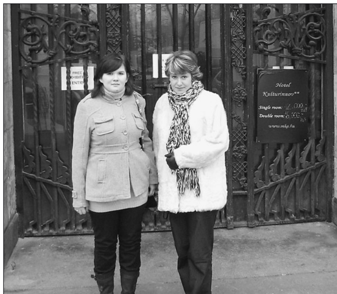
A magyar kultúra alapítvány székháza előtt