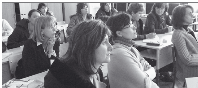
A pedagógusok érdeklődéssel hallgatják az előadót

A pedagógusok nyitottsága és pozitív hozzáállása még a késő délutáni órákban sem lankadt. Ez a tény az előadókat is újabb feladatok elvégzésére ösztönözte. Reméljük, a képzés folytatása is hasonlóan jó hangulatban fog végbemenni.