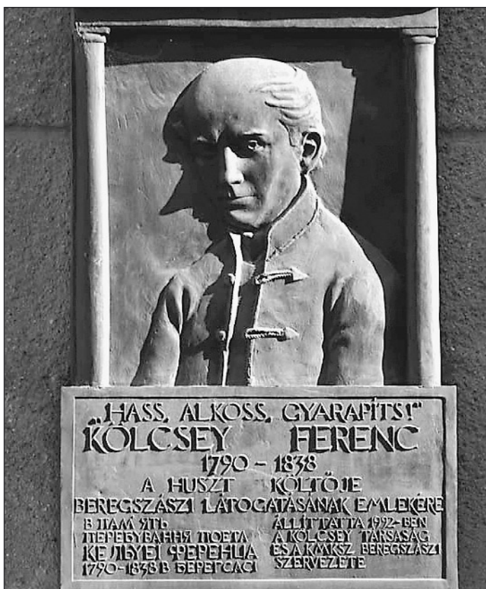
Kölcsey Ferenc emléktábla Beregszászban

a Himnuszt, Csekén csupán végleges formába öntötte.