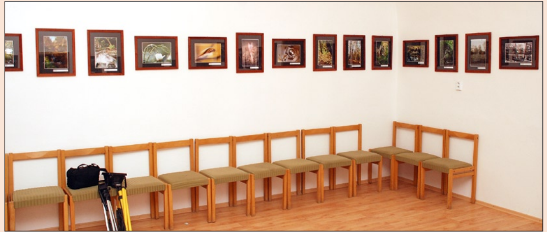
Csendélet egy munkaeszközzel, székekkel és képekkel