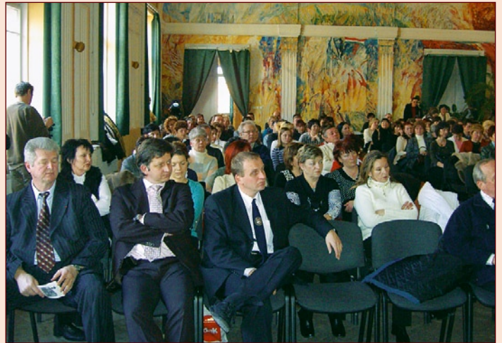
A megnyitói résztvevői