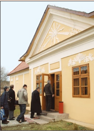
A felújított kastély bejárata