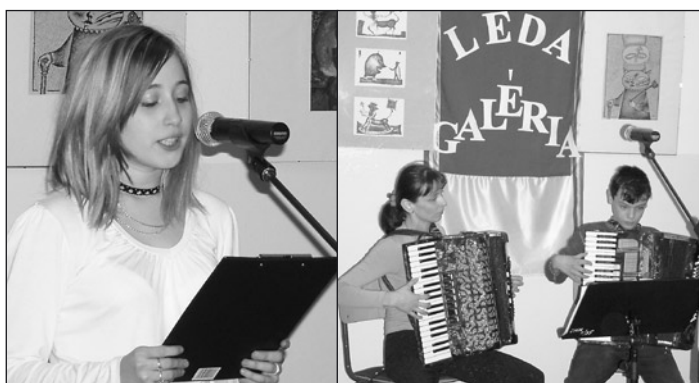
Az ünnepélyes megnyitákon iskolánk tanulói adják a kultúrműsort

Miért Léda Galéria? Az Ady Endre Alapiskola e névvel utal arra, hogy a műsának, az ösztönzésnek, a lelkesítő erőnek mindig nagy szerepe van az alkotásban.