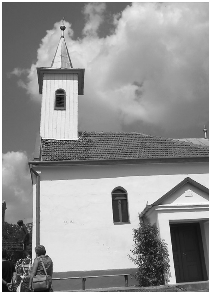
A református templom, ahol annak idején Kölcseyt is keresztelték

A vékonydongájú, karcsú férfitestet ábrázoló szobron csupán ennyi áll írott betűkkel: Kölcsey. A helybeliek szerint itt, a domboldalon írta meg nemzeti imánkat,